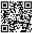
S510 3D demo