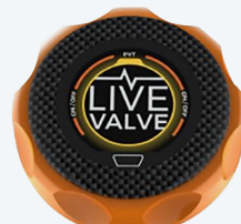
Personalizado - ejemplo 2