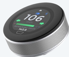
T.E. 1.3" endurecido