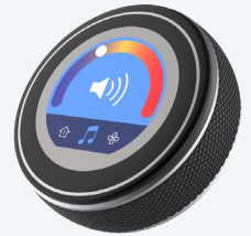
Rueda de diamante negra