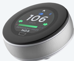
T.E. 1.3" pulido