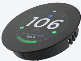
T.E. 2.1" a filo