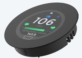
T.E. 1.3" enrasado