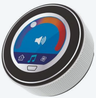
Rueda de diamante plateada