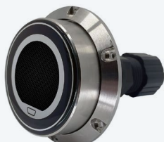
Personalizado - ejemplo 1