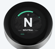
Personalizado - ejemplo 3