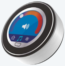
Acabado en plata pulido

Explore la exclusividad de nuestra variada gama de modelos y descubra también las posibilidades de personalización que le ofrecemos.