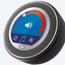
Mango de silicona negro