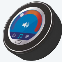
Acabado en negro pulido